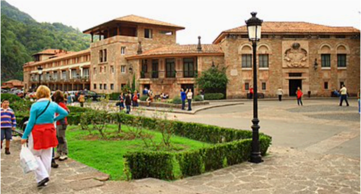
Explanada de la basílica